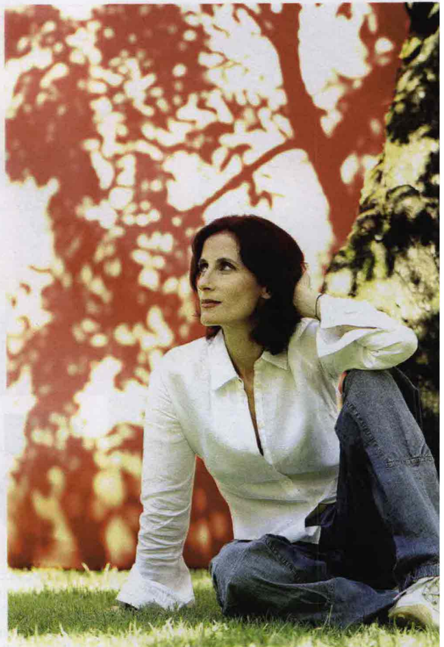
MARGARET MAZZANTINI. NELL'ALTRA PAGINA: HELEN FIELDING, L'AUTRICE DEL "DIARIO DI BRIDGET JONES", E SOTTO ERIKA LEONARD (E. L. JAMES)