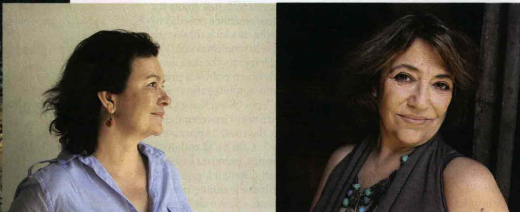
VIRGINIE DESPENTES. SOTTO: CLARA SANCHEZ E MARCELA SERRANO. NELL'ALTRA PAGINA: ISABEL ALLENDE

S e leggere un romanzo è un tuffo, quello nel rosa è un doppio carpiato con avvita-mento. Garantisce l'immersione nell'intreccio, una deliziosa rinuncia all'autocontrollo e un ritorno a galla ritemperati e risarciti. Alla voce "rosa" della classifica di Amazon, accanto alla trilogia erotica di E. L. James (vedi box) e all'ultimo libro di Sveva Casati Modignani, capita di trovare "Anna Karenina" di Tolstoj o "L'ultima riga delle favole" di Massimo Gramellini. Non c'è da stupirsi. Dietro ai numeri di Amazon preme un esercito di amazzoni onnivore, capaci di riconoscere le sfumature del rosa anche nascoste tra le pieghe della grande letteratura. A soli 23 anni la Némirovsky, punteggiando le pagine del suo primo romanzo "Il malinteso" (Adelphi) con «la luce del sole filtrava e si diffondeva rutilante e fulva come una splendida capigliatura» e con occhi maschili «di velluto e di fuoco», intinge la penna nell'inchiostro del rosa. Il fatto è che, dal cipria allo shocking, il rosa occupa militarmente le classifiche delle vendite. Lettrici forti (54 per cento contro un 46 di maschi), le donne rimangono padrone di un genere in piena mutazione. Le ragazze dell'happy hour cercano l'happy