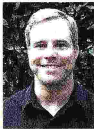
Andy Weir (Davis, California, 1972)

Un equipaggio spaziale americano è sbarcato da appena una settimana su Marte quando si scatena una furiosa tempesta di sabbia. Il vento scardina e fa volare via l'antenna radio che metteva in contatto i cosmonauti con la Nasa a Houston. Un pezzo dell'antenna s'infilza come una freccia nel fianco di Mark Watney, l'ultimo in ordine gerarchico dell'equipaggio. L'uomo, trascinato dall'uragano, scompare alla vista mentre i suoi compagni lo danno per morto e abbandonano il pianeta per ritornare a casa. Ma Mark Watney, astronauta, ingegnere meccanico e botanico, ha la pelle dura e sopravvive all'incidente. Forse era meglio restarci secco, si direbbe, vista la situazione in cui si trova. Non può più parlare con la Terra a causa della perdita dell'antenna.