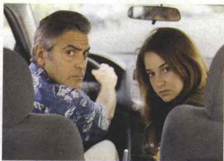
• Nell'altra pagina, in alto, da sinistra, Rooney Mara (26) e Daniel Craig (43) ; Mia Wasikowska (22) e Glenn Close (64) . • Qui sopra, George Clooney (50) e Shailene Woodley (20) .

Lo spunto è il libro I discendenti di Kauai Hart Hemmings (Newton Compton). Il regista Alexander Payne ne ha tratto un film agrodolce, fatto su misura per il protagonista George Clooney . L'attore è un avvocato che, insieme alle figlie, va in cerca dell'amante della moglie, rimasta in coma. Nomination all'Oscar per lui, quest'anno in gara anche per la sceneggiatura di Le idi di marzo . Dal 17/2