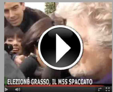
Il TG di Affaritaliani del 18/03/2013.