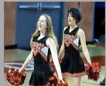
Paris, la figlia (punk) di Michael Jackson diventa cheerleader...