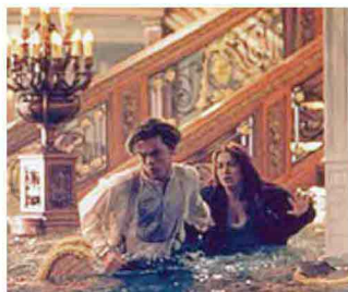
Un candelabro, una tazza e un binocolo provenienti dal Titanic. Qui sopra, DiCaprio e la Winslet in una scena del film