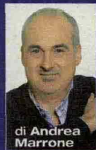
di Andrea Marrone

In libreria A metà tra il gossip e le confessioni il libro dell'attrice-regista