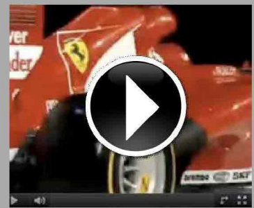
Ferrari marchio più forte del mondo secondo Brand Finance...