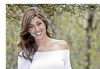
Belén da Oscar