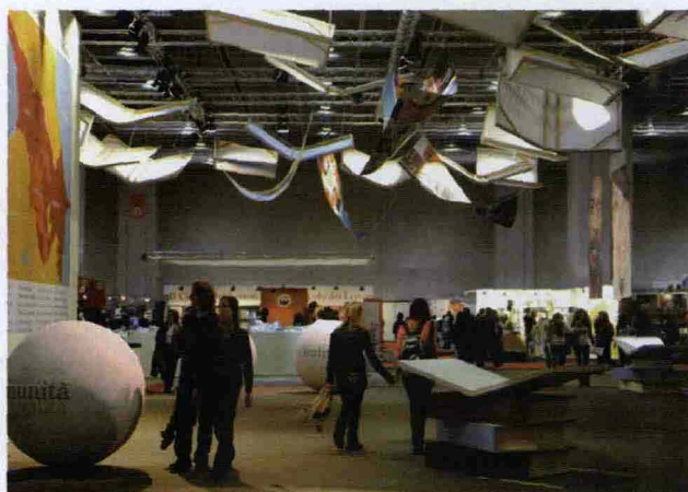
Il Salone internazionale del libro di Torino sarà aperto al Lingotto dal 12 al 16 maggio. Info: salonelibro.it