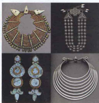
Bérénice Geoffroy-Schneiter, Gioielli d'Asia , Skira, pp. 312, €35.

“Lo sai che amo solo te al mondo, ma quella donna non era come le altre”