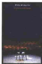
L'umiliazione di Philip Roth (Einaudi)

rotto. Il mattatore non sa e non vuole più recitare. Precipita in una depressione senza fondo (intanto il suo matrimonio, piovuto sul bagnato, è andato a rotoli), e valuta, con euforia, l'ipotesi del suicidio. Per restare a distanza di sicurezza dall'attrazione fatale esercitata su di lui dal fucile a pompa Remington 870 che conserva in cantina, si ricovera per un mese in clinica psichiatrica.