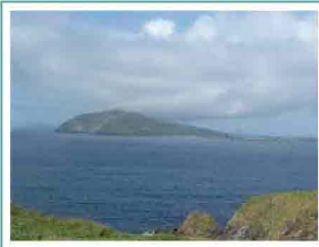
Great Blasket Island L'isola da cui la scrittrice ha tratto ispirazione per creare Tara.

E dopo le difficoltà iniziali, il calore e l'affetto della piccola comunità di Tara finiranno per conquistare anche la festaiola Darcy. Nuovi amici e forse un nuovo amore l'attendono dietro l'angolo: chi, tra il bellissimo Conor e il testardo Dermot, saprà far battere il suo cuore?