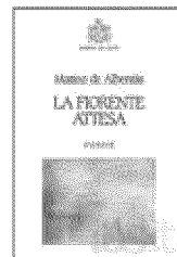
Matteo De Albertiis La fiorente attesa Edizioni del Leone pp. 48 € 6,00