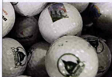
Sopra, palline da golf del Giubileo 2000 da Savelli. Sotto, un gioiello di Percossi Papi.