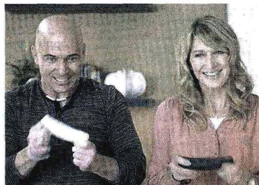
Andre Agassi e Steffi Graf, testimonial della Wii

WII FIT U ANCHE SCARICABILE DA NINTENDO E-SHOP IN PROVA GRATUITA PER 31 GIORNI