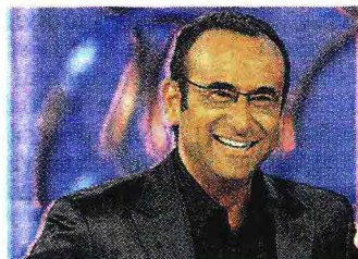
Carlo Conti, volto di Rai 1

Come ormai tradizione, questi sono i giorni di Telethon, la raccolta di fondi per la ricerca biomedica nel campo delle malattie genetiche rare, che sono diverse migliaia e, per un 70%, pediatriche. La classica maratona radio-tv si concluderà questo week end, coinvolgendo tutti i volti più noti della tv. Il totalizzatore che conta i soldi raccolti si fermerà domani sera nel programma «L'eredità», condotto da Carlo Conti. Sul sito Telethon.it c'è poi la possibilità di acquistare regali e si può consultare il calendario delle tante iniziative in corso in tutte le città. Fino a domani, in particolare, grazie a centinaia di volontari, Telethon sarà presente in più di mille piazze d'Italia con i cuori di cioccolato, da 200 gr ciascuno, creati da un artigiano bellunese e disponibili nella versione fondente o al latte. La donazione minima è di 10 euro.