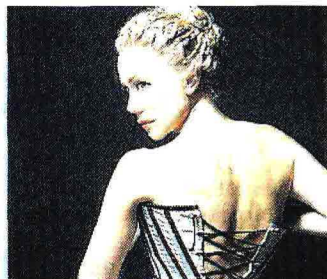
Nancy Brilli ne «La locandiera»