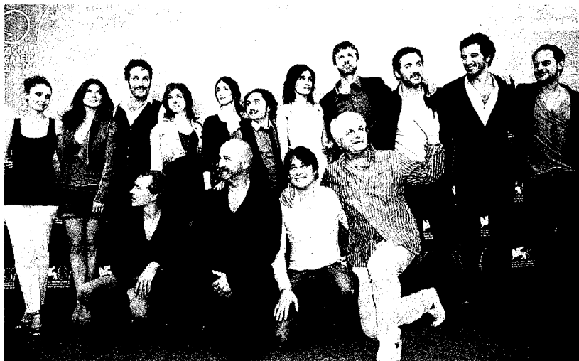
Il cast del film Gli angeli del male di Michele Placido

«Ho visto solo pezzi e letto la sceneggiatura, ma una volta ho detto a Michele: mi sembra di essere un matto scatenato, che non va a letto se non ha fatto disastri e non si alza se non ha scopato almeno tre donne. Questo non sono io. Mi sono lamentato — continua Vallanzasca — perché non riconoscevo dei personaggi».