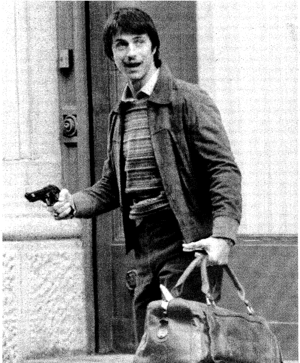
Protagonista Kim Rossi Stuart sul set del film «Vallanzasca Gli angeli del male»