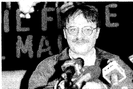
Bandito Renatino Vallanzasca

Quello che viene raccontato in «Vallanzasca Il bandito gentiluomo» di Vito Bruschini (Newton Compton) è il lato oscuro degli intrecci tra questi criminali e la mafia siciliana, i poteri dello Stato, i servizi segreti, la nuova camorra, la grande massoneria, il terrorismo nero e rosso. In questo scenario di violenza si muove Renatino, l'affascinante e feroce capo della banda della Comasina, tra misteri e delitti. Dall'altro lato della barricata, il vice-commissario della Squadra Mobile di Milano, Moncada, tenterà di rimettere al loro posto le tessere del mosaico. Due destini esemplari, condannati a incrociarsi. Altro libro già uscito è «L'ultima fuga. Quel che resta di una vita da bandito», scritto a quattro mani da Renato Vallanzasca e Leonardo