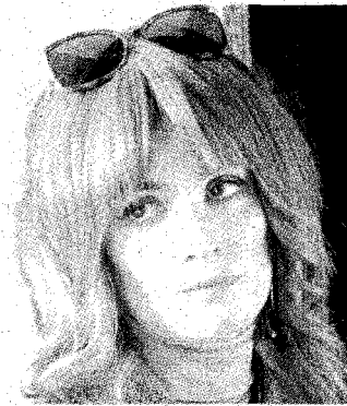
Diva Paz Vega