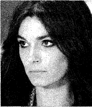
Attrice Valeria Solarino