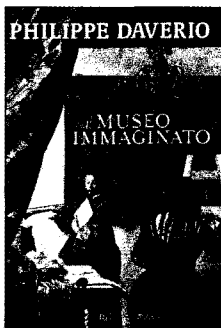
Philippe Daverio 'Il museo immaginato' Rizzoli 351 pagine, 35 euro

per costruire un buon museo è la capacità di 'capire' i dipinti e per farlo bisogna introiettare una norma: guardarlo a lungo. Non si può capire un quadro prestando un'attenzione non superiore ai venti secondi. Come riprova l'autore suggerisce di cominciare prendendo dal web una riproduzione dei 'C