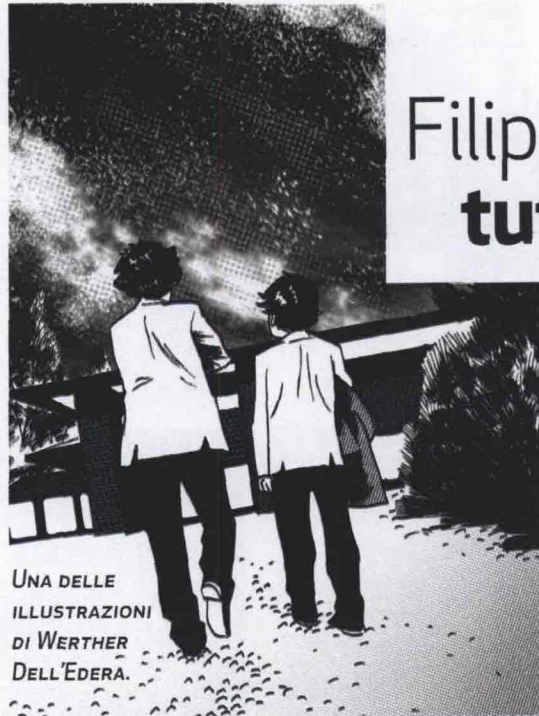
UNA DELLE ILLUSTRAZIONI DI WERTHER DELL'EDERA.