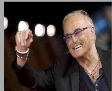
La figlia e la nipote del "Califfo" (un rapporto