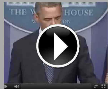
Attentato alla maratona di Boston...