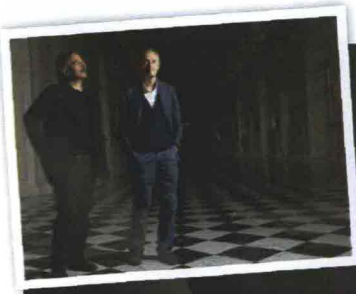
Gianmaria Testa e Erri De Luca.